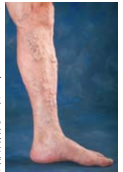
下肢静脈瘤の一例

A 「下肢静脈瘤」とは、本来、心臓に戻るはずの足の血液（静脈血）がいつまでも足にとどまることで起こる病気です。静脈の中にある逆流防止弁が何かの理由で壊れることにより発症します。