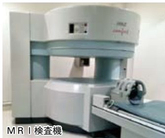
MR I 検査機