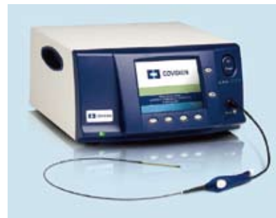
下肢静脈瘤高周波カテーテル治療機(ラジオ波による血管内焼灼術)

A 下肢静脈瘤は慢性疾患のため放置しても生命に関わる可能性は低いのですが、傷が治りにくかったり、感染症を併発したり、うっ滞性皮膚炎(色素沈着になる場合も)があります。病期によっては治療が難しくなることがあり、自己判断せず専門医の診察を受けることが望ましいです。予防法として、静脈の逆流を防止する弾性ストッキング(着圧ストッキング)の着用が推奨されます。こむら返りなどに漢方薬が効果的ですが、静脈瘤は